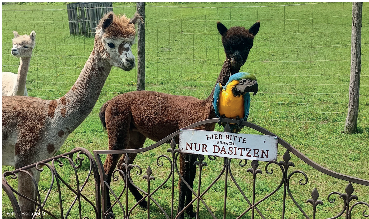
Sweet home Alpakas - Staudach